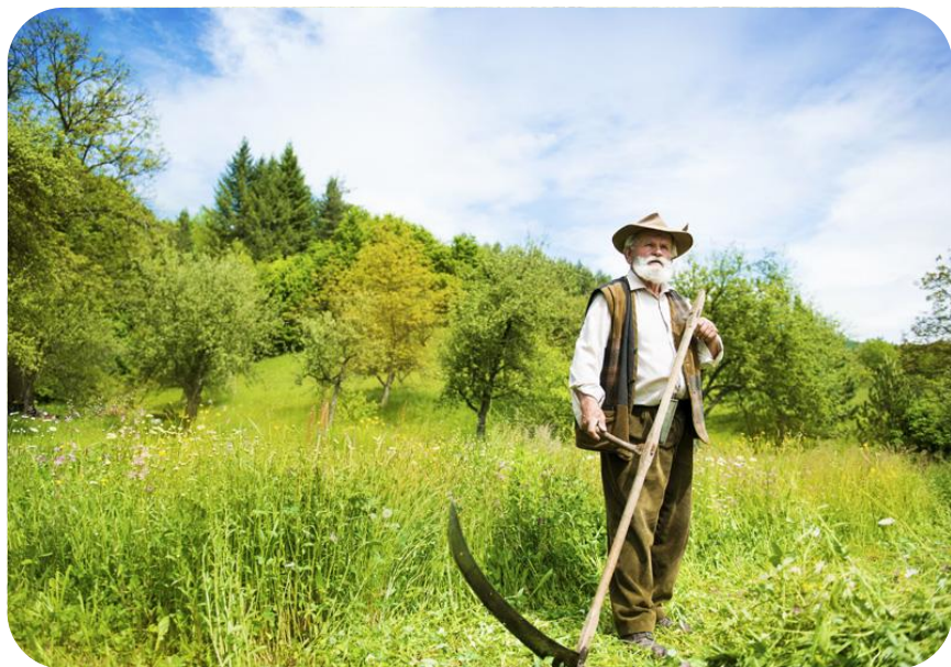
Кошење траве косом